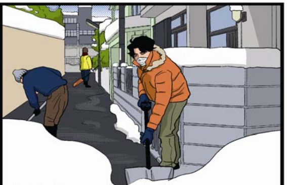
大月市での除雪ボランティア