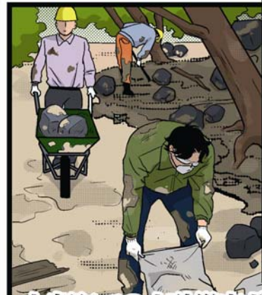
大島町での土砂災害ボランティア

草の根外交 モザンビーク共和国 を訪問し、元首相や 元閣僚と意見交換を 行いました。